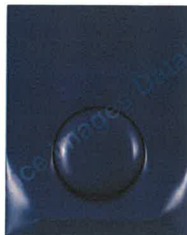
Abbildung auf Seite 34 des Katalogs