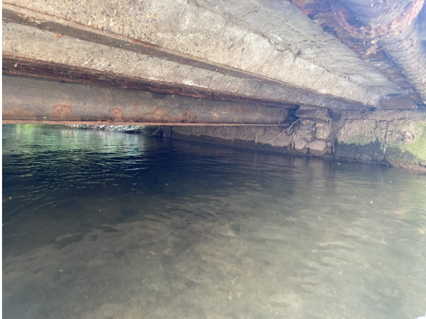
Abbildung 2: Korrosionsschäden an den Trägern

Aufgrund von Schäden am Kragarm ist die Standsicherheit des Bauwerks beeinträchtigt und wird daher mit der Zustandszahl 3 bewertet.