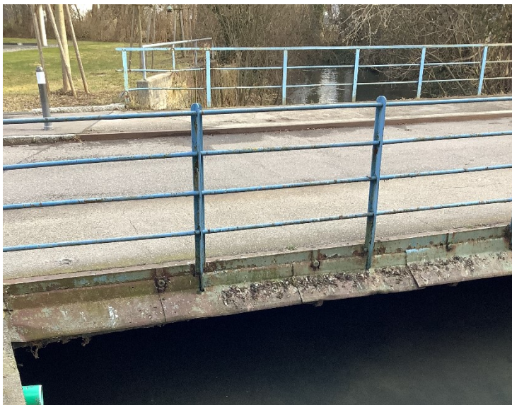
Abbildung 1: Bestandsbauwerk

Im Zuge der Bauwerksprüfung nach DIN 1076 wurden im Jahr 2021 Schäden an der Brücke festgestellt. Die Zustandsnote von 3,8 (Abbildung 1) ergab sich vorrangig durch die fortgeschrittene Korrosion des Haupttragwerks und somit Traglastverlust der Gehweg-Randträger.