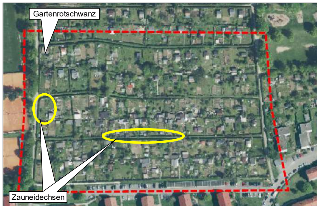
Abb. 4: Teilfläche 3 oberhalb der Sonnenhalde, Westteil. Kartengrundlage: Stadt Ulm

Großbäume sind fast nur im Umfeld (östlich und westlich) vorhanden; die wenigen größeren Bäume in den Gärten sind oft gekappt und wenig stark, sodass nur wenige