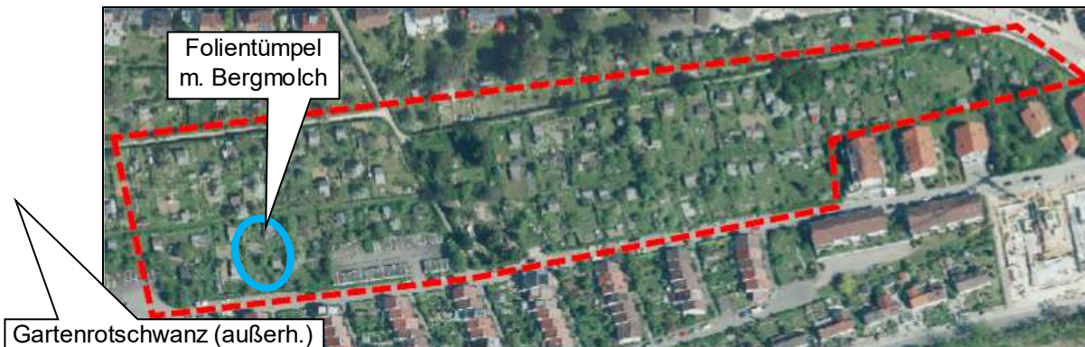
Abb. 3: Teilfläche 2 nördlich des Wilhelm-Geyer-Wegs. Kartengrundlage: Stadt Ulm

Diese Teilfläche ist relativ strukturarm; es gibt nur wenige Großbäume, davon wenige Obstbäume, die meist noch gekappt sind. Überall hängen aber wieder viele Vogelnistkästen. Bemerkenswert sind außerdem Fledermauskästen an den Giebeln der Häuser Wilhelm-Geyer-Weg 34-46, auch wenn keine ausfliegenden Tiere beobachtet werden konnten.