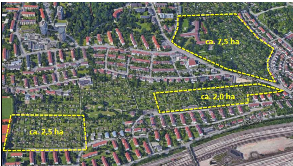
Abb. 1: Abgrenzung der drei untersuchten Kleingartenanlagen. Karte: Stadt Ulm

Der Fokus lag auf geschützten Arten. Dazu wurden im Jahr 2017 in allen drei Teilgebieten die strukturtypischen und artenschutzrelevanten Tiergruppen Fledermäuse, Vögel und Reptilien erfasst.