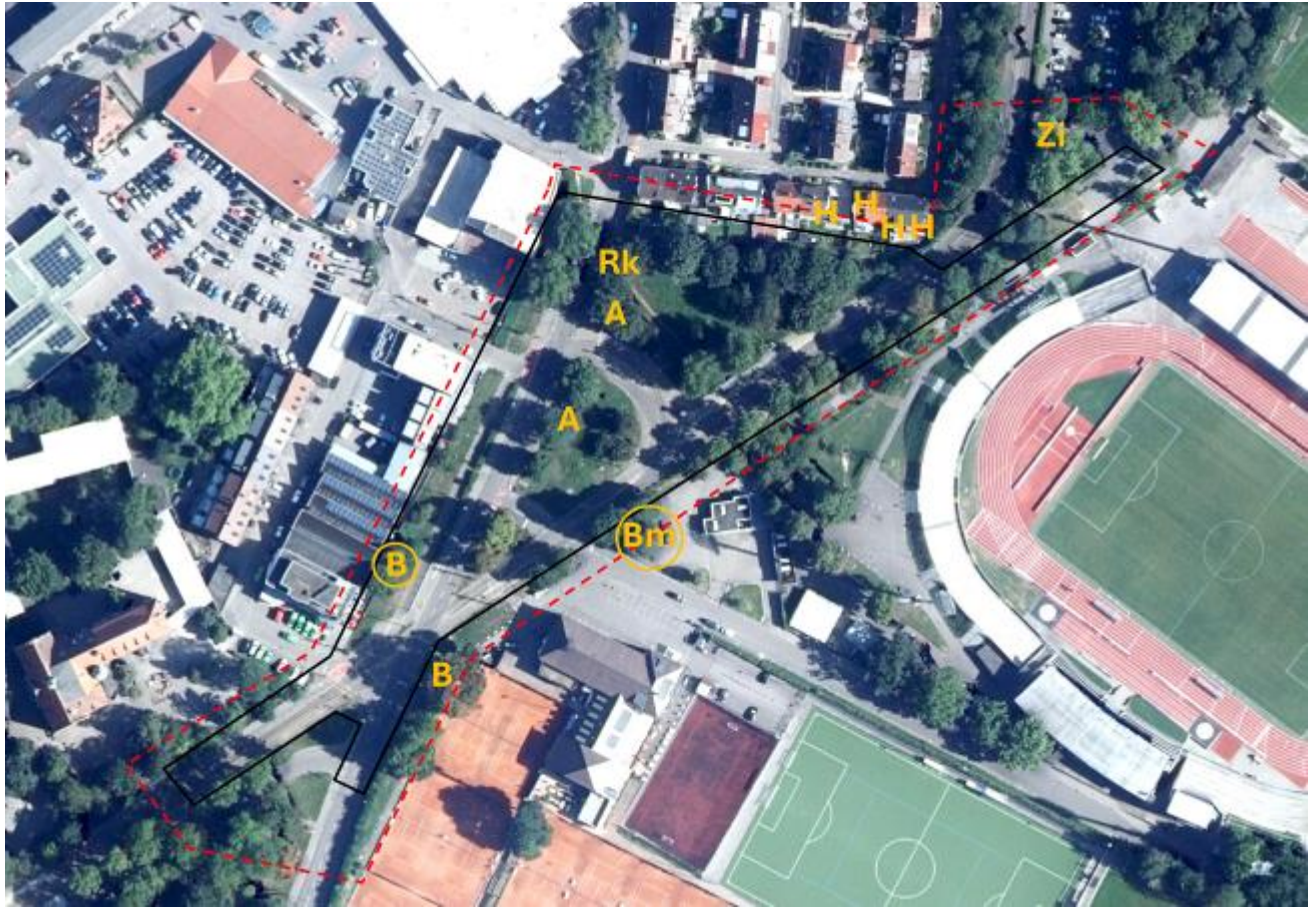
Abb. 5: Brutvogelnachweise