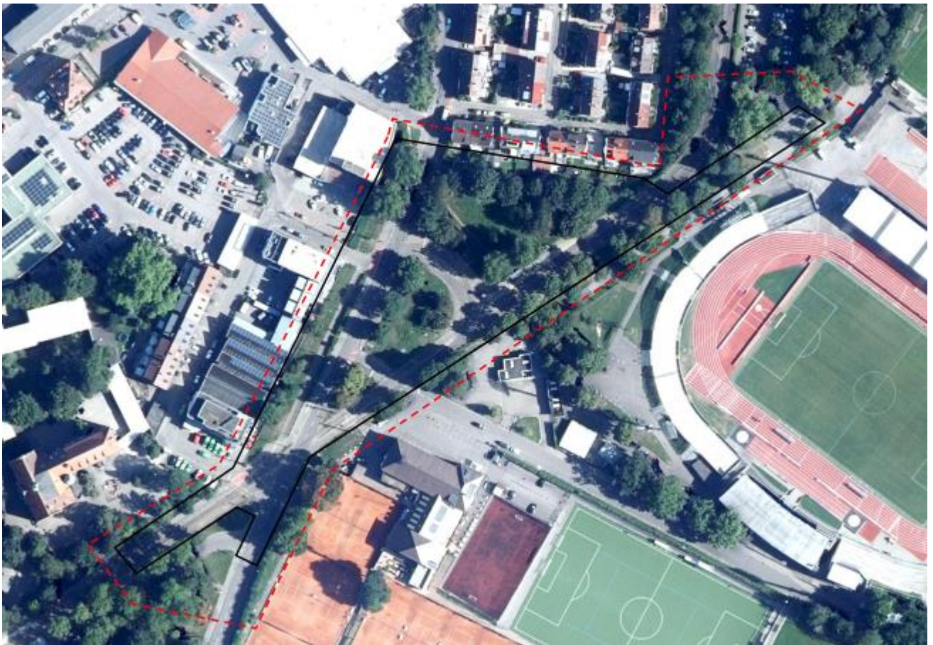
Abb. 1: Plangebiet: schwarz=Vorhabensfläche, rot=Untersuchungsgebiet

Im Zuge der Umplanung sind Bäume betroffen und die Fahrgastunterstände werden versetzt. Das vorliegende Projekt umfasst die in der folgenden Abbildung dargestellten Grundstücke. Der Untersuchungsumfang umfasst die Vorhabensfläche und das direkt angrenzende Umfeld.