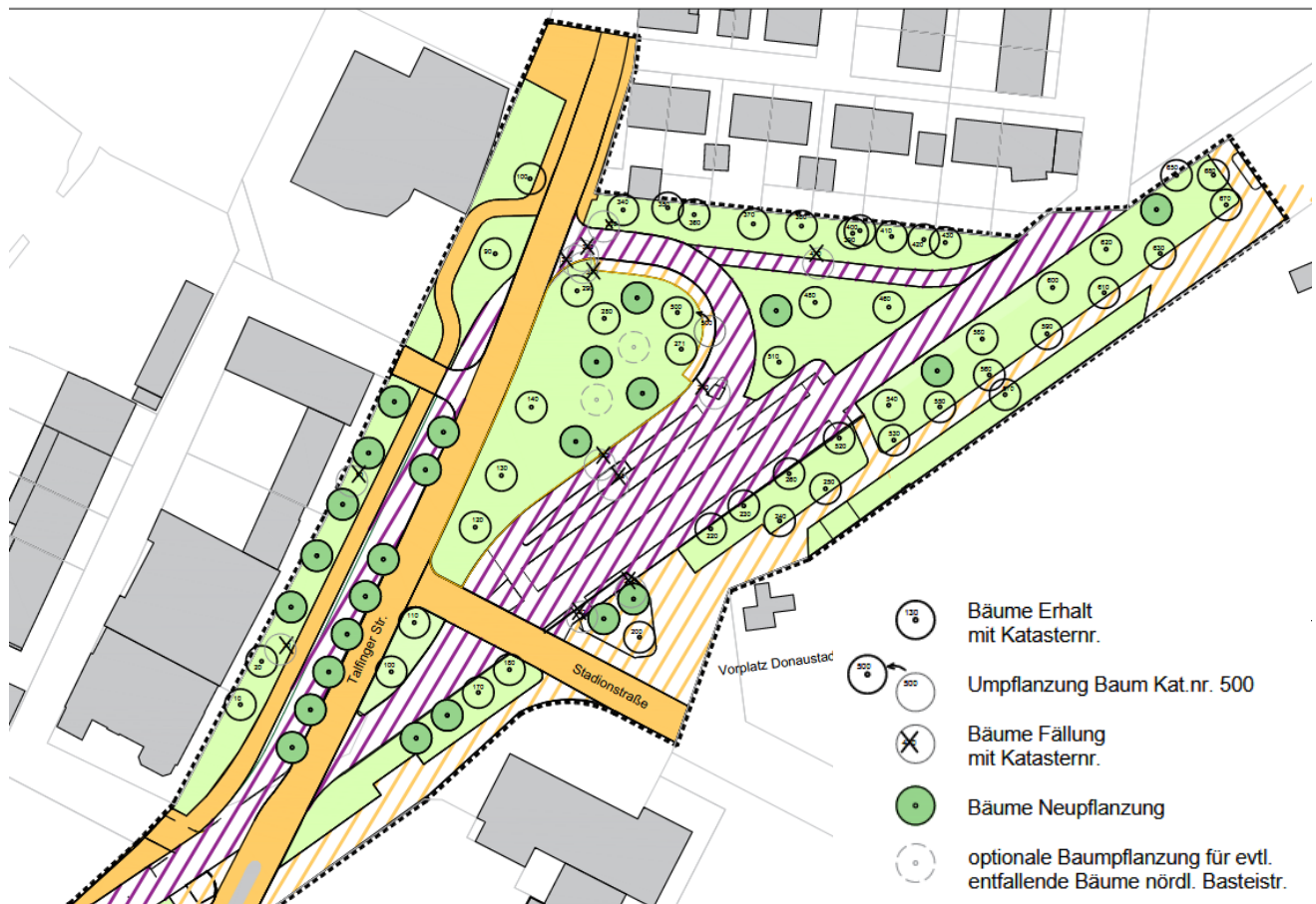
Abb. 2: Lageplan Bauvorhaben mit betroffenen Bäumen (Irsch – Rauh Partner 2024)