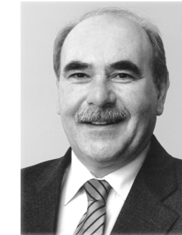
Ivo Gönner Oberbürgermeister