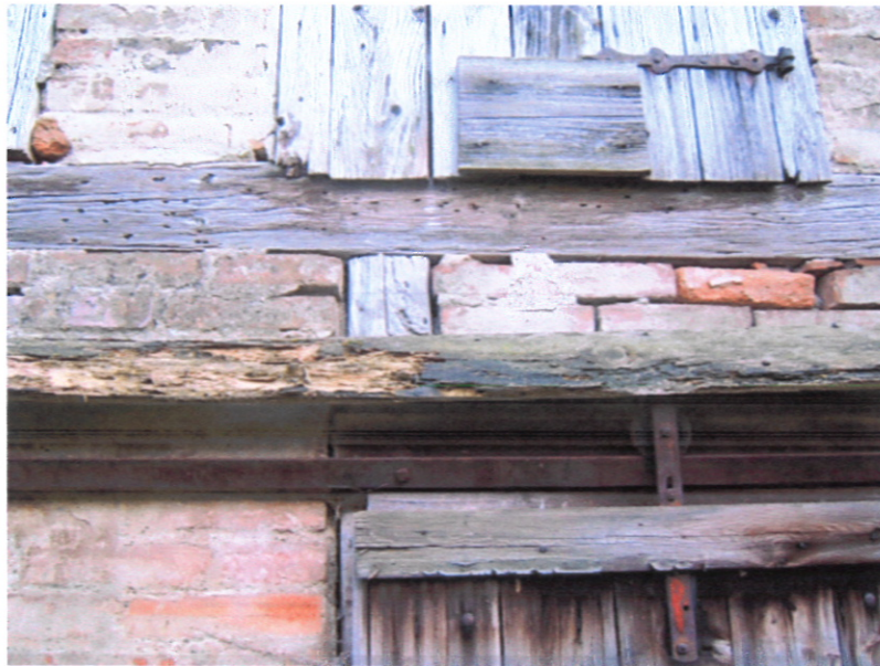
Abb. 3: Potentielle Spaltenquartiere für Fledermäuse