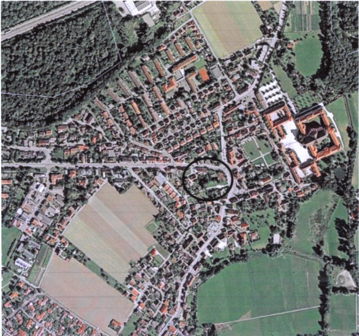
Abb. 1: Lage der Vorhabenfläche

Der Betrachtungsraum der artenschutzrechtlichen Prüfung umfasst das Vorhabensgebiet und die angrenzenden Grundstücke. Die Lage der Vorhabenfläche ist aus Abb. 1 ersichtlich.