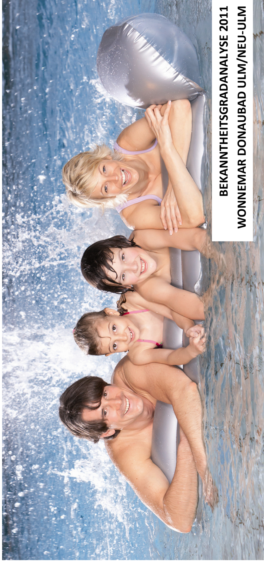
BEKANNTHEITSGRADANALYSE 2011 WONNEMAR DONAUBAD ULM/NEU-ULM