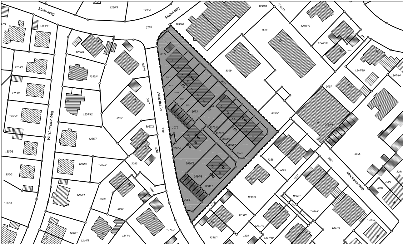
Übersichtsplan M 1 : 2000