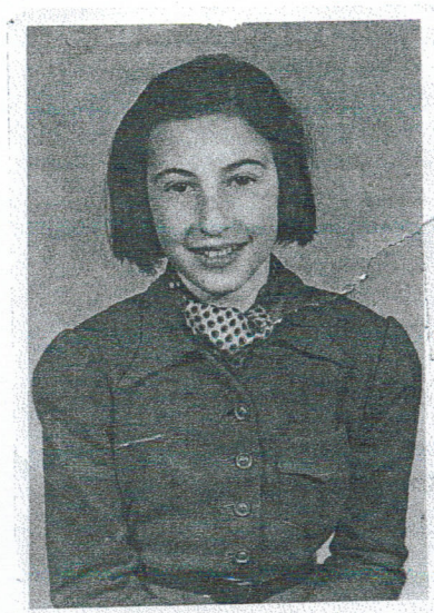
Esther Bejarano 1938.