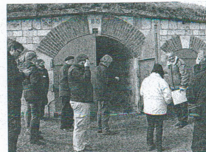
Teilnehmer/-innen des Lehrerseminars in der Gedenkstätte.

15.-16. März: „Das KZ Kuhberg: Tatort und Gedenkstätte“. Landesweites Seminar für Lehrer aller Schultypen mit der LpB Ba-Wü.