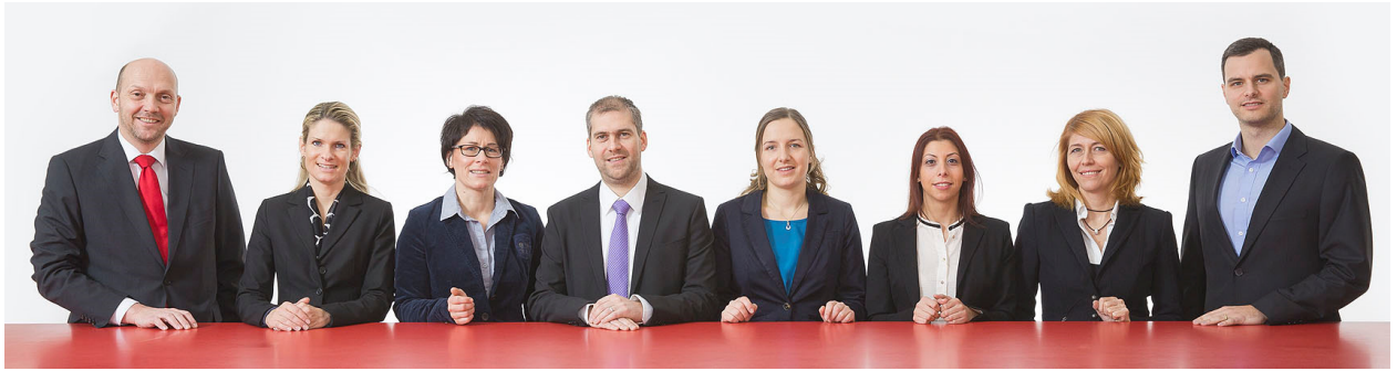
Das Team der PEG 2013