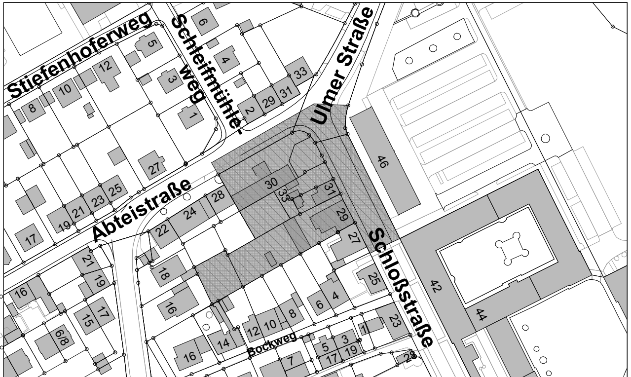
Übersichtsplan Maßstab 1: 2500