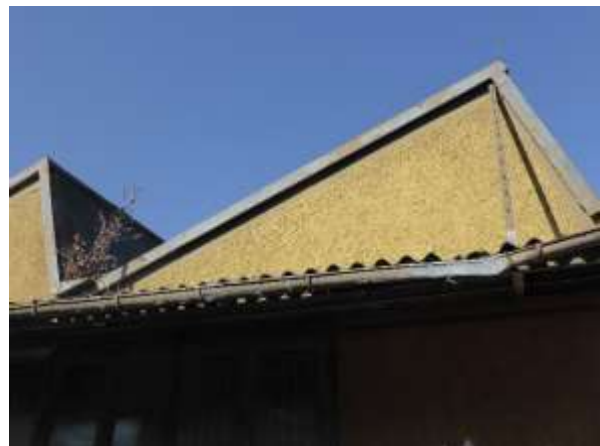
Dachüberstände entlang der Kleiststraße.