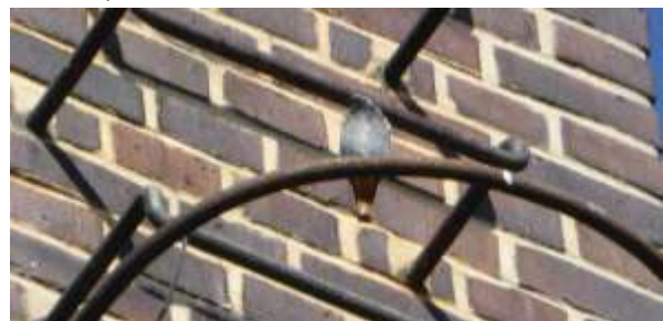
Hausrotschwanz auf Kamin des Gebäudekomplexes.