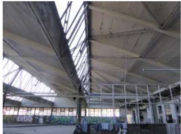
Vollständig unterkellerte mittlere Halle hinter Bürogebäude.