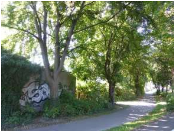
Nordwestecke der Garagen, von außen.