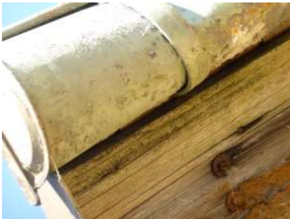
Detail: Dachüberstand mit Spalten.