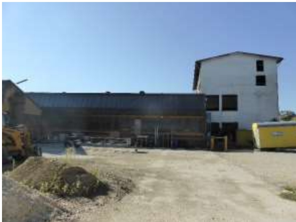
Blick aus dem Hof von Norden: Rechts Bürogebäude, mittig mittlere Hallen, links nördliche Hallen.