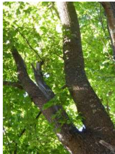
Exemplarischer Baum, dicht belaubt, mit Riss.