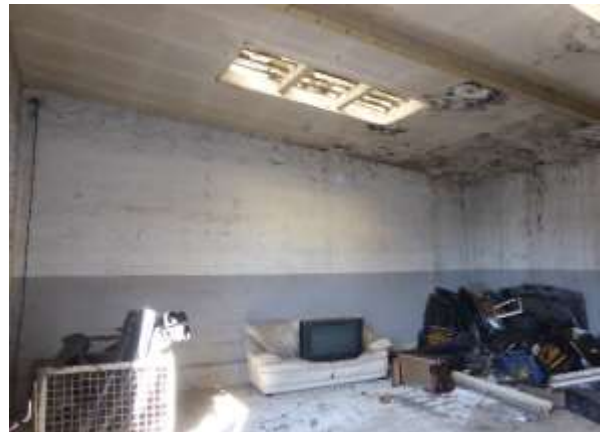
Typisches Innenleben der Garagen ...