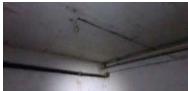
... und mit glatten Decken ohne Fugen.