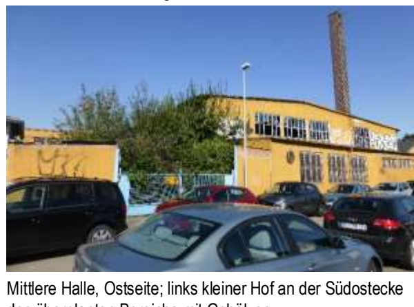
Mittlere Halle, Ostseite; links kleiner Hof an der Südostecke des überplanten Bereichs mit Gehölzen.