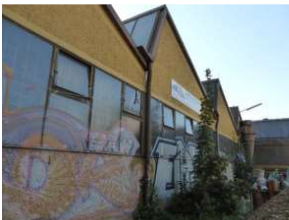
Nördliche Hallen von Westen