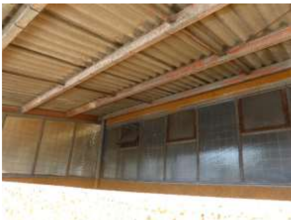
Überdach über Rampe an der Kleiststraße.