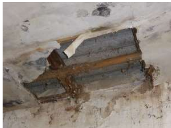
... mit minimalst isoliertem Dachaufbau.