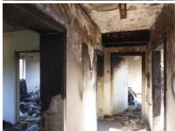
Verschiedene Räume des Bürogebäudes – in verschiedenen Zuständen.