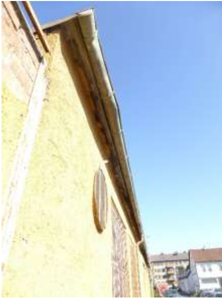
Mittlere Halle, Ostseite an Kleiststraße.