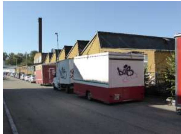
Blick von der nördl. Kleiststraße auf den Gebäudekomplex.