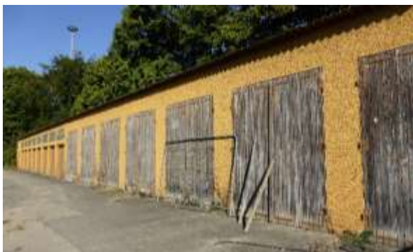
Garagen-Reihe im Norden, von Osten aus.