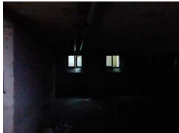
Keller: Dicht, dunkel ...