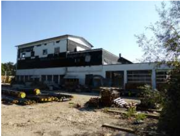
Bürogebäude von Südwesten, der bisherigen Einfahrt her.