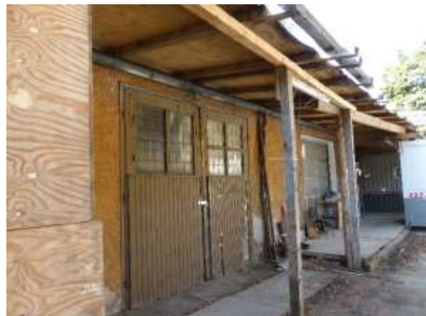
Anbau im Norden an nördliche Halle