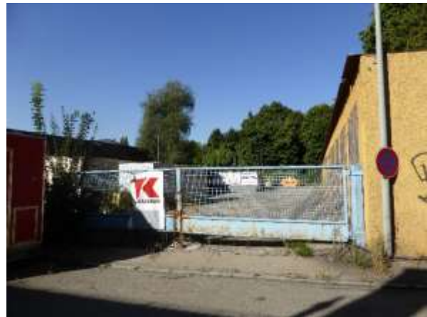
Tor im Nordosten.