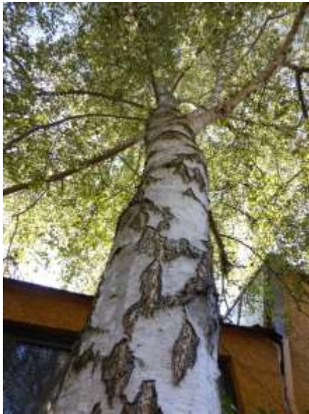
Große Birke im Hof.