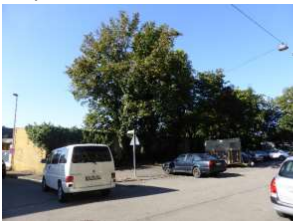
Ecke Mörikestraße (rechts) – Kleiststraße (links)