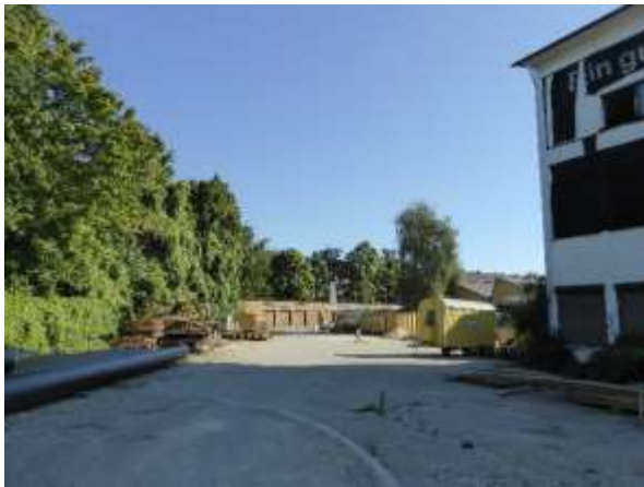
Blick aus der Einfahrt Innere Wallstraße in den Hof, rechts Bürogebäude, im Hintergrund die Garagen.