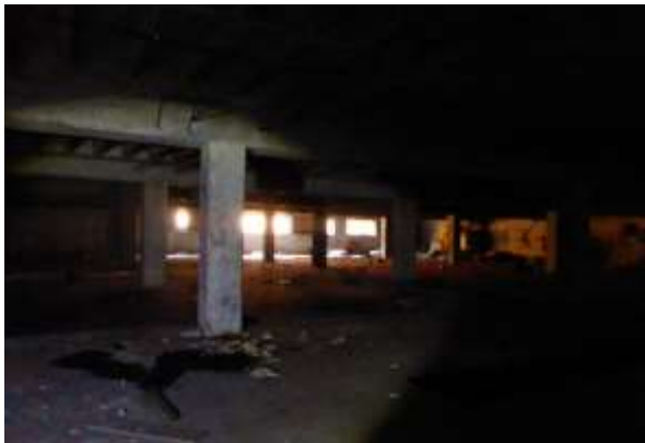
Der Keller dazu.