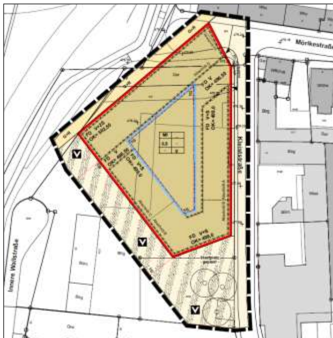
Abb. 3: Grenze des Bebauungsplans.

Alle Gebäude werden abgerissen, dabei werden auch alle Gehölze auf dem Grundstück entfernt. Für die geplanten Neubaumaßnahmen (Abb. 3) muss auch der gesamte Gehölzbestand außerhalb entlang der Grenze sowie auf der Fläche gerodet oder zurückgeschnitten werden.