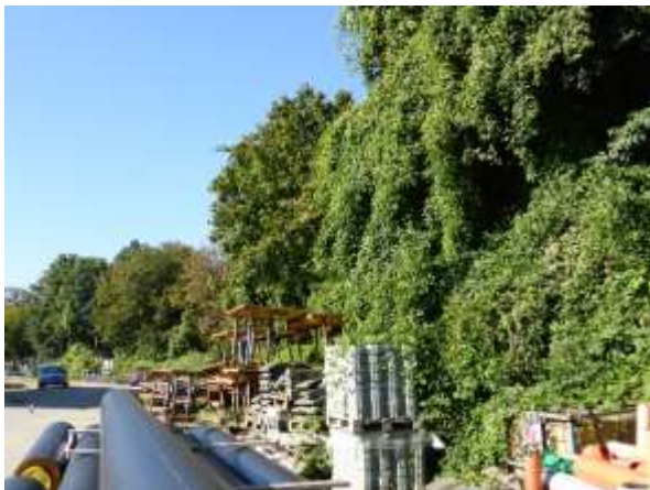
Materiallager am Westrand.