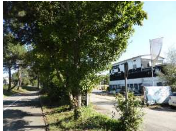
Grünanlage, Blick vom Nordende der Inneren Wallstraße aus nach Norden; rechts Bürogebäude.