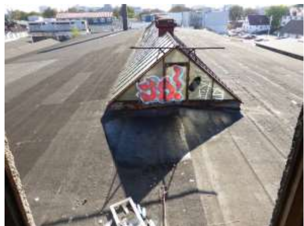
Mittleres Hallendach vom Bürogebäude aus.