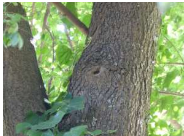
Detail: Astloch in Baum.