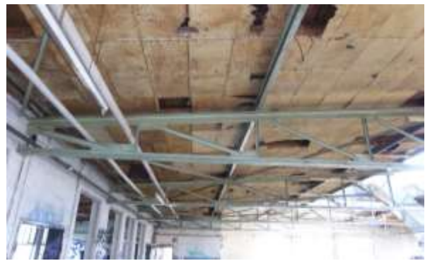
Decke der mittleren Halle innen mit Styropor verkleidet