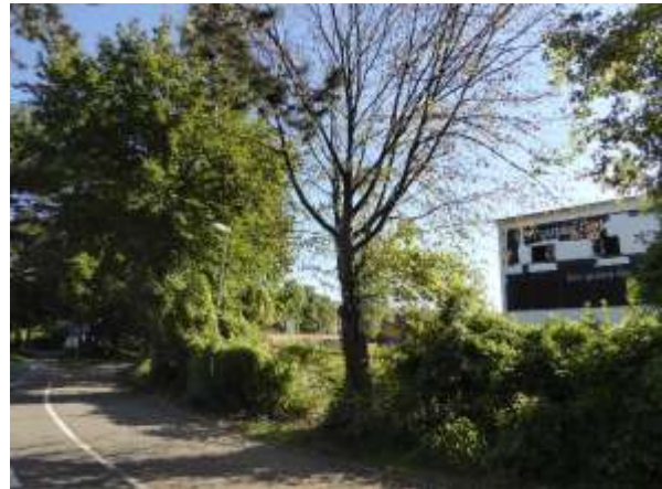
Etwas weiter nördlich.