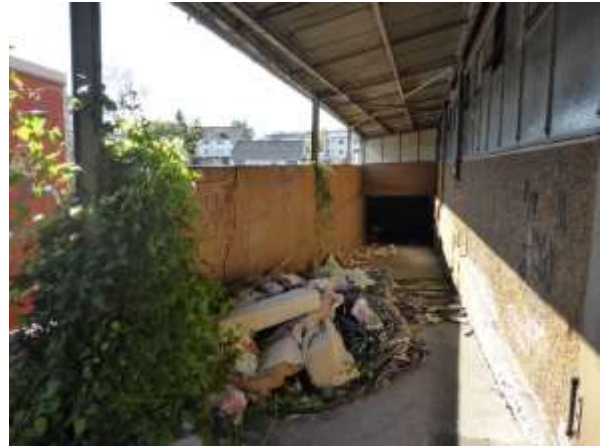
Die Rampe dazu.