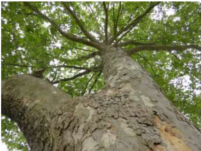
Abb. 7: Blick am Stamm nach oben in eine Platanen-Krone. Die Rinde plättelt arttypisch kleinflächig ab, steht dabei aber kaum ab.