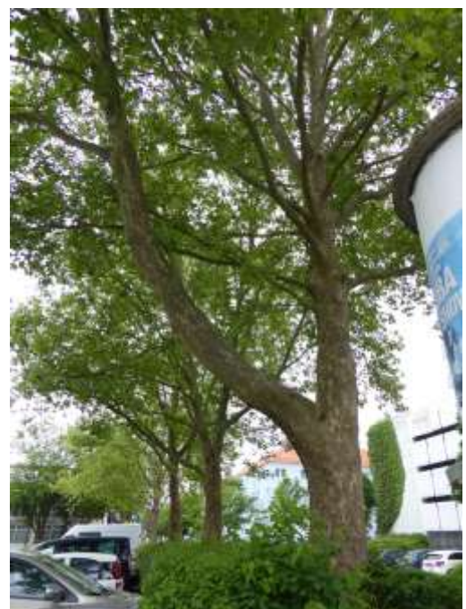
Abb. 4 (rechts): Vordere Baumreihe mit Hecke.