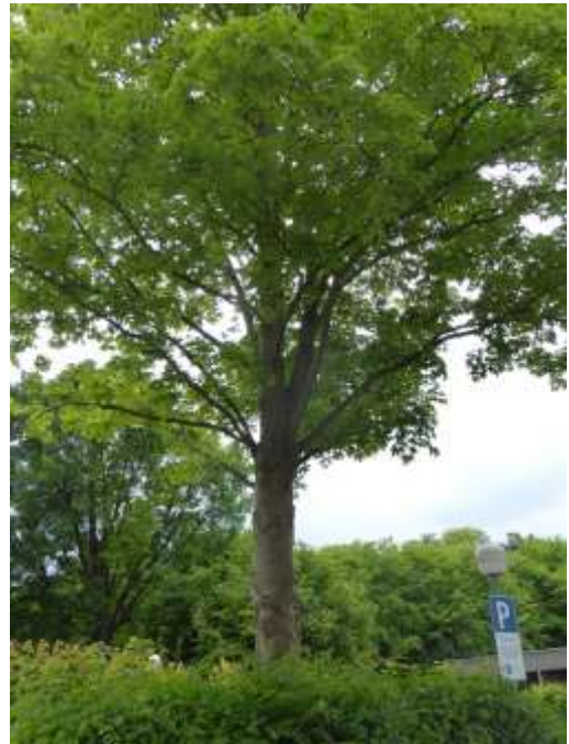
Abb. 6: Ahorn im Südwesten.