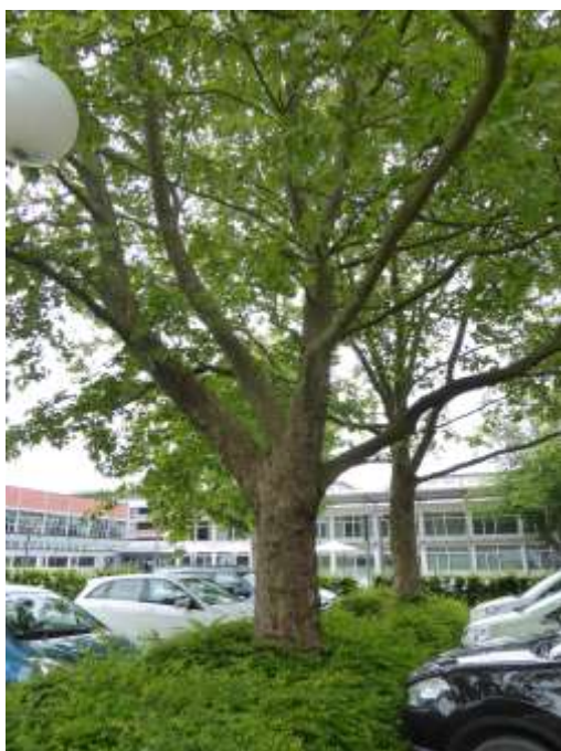
Abb. 3 (links): Hintere Baumreihe mit Hecke (ohne Ahorn).

● Amsel-Nest in Hecke; BHD = Brusthöhendurchmesser der Stämme. Plan links: Stadt Ulm; Luftbild rechts: LUBW-RIPS.