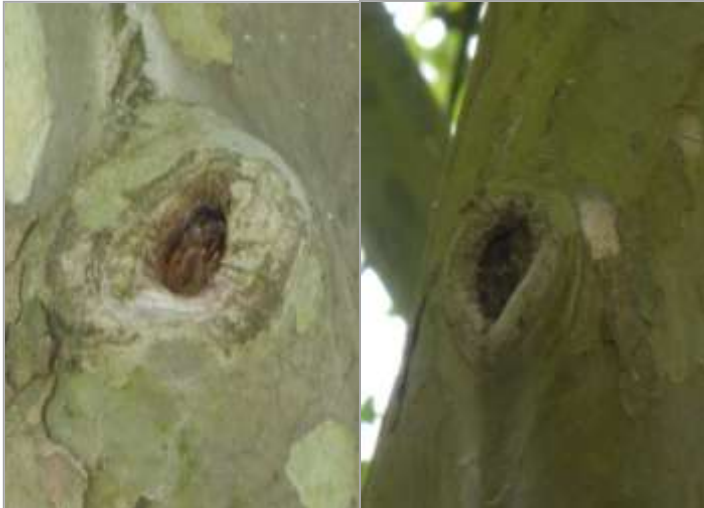
Abb. 5: Zwei Astabbrüche mit Hackspuren.

Höhlen in den Bäumen konnten vom Boden aus nicht festgestellt werden. Einige Astabbrüche waren teilweise angehackt (vermutlich von Spechten), aber nicht hohl. Auch Großvogelnester (Horste) oder Nester anderer Vogelarten im von unten sehr gut einsehbaren Geäst der Bäume waren nicht vorhanden.