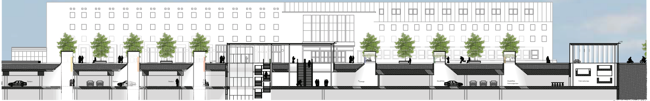
Schnitt A-A M 1:200