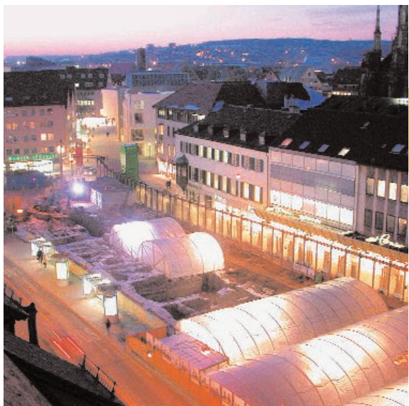
Grabung im Winter 2002/03