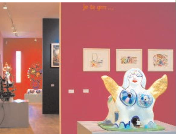
Blick in die Ausstellung im Ulmer Museum

Mit Unterstützung der Stiftung Landesbank Baden-Württemberg LB BW