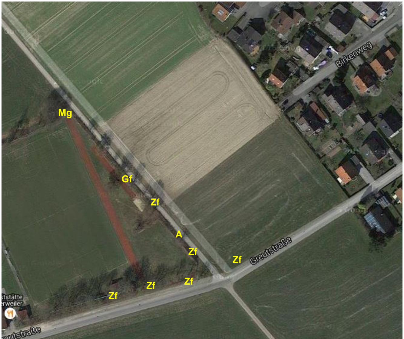
Abb. 2: Artenvorkommen: Zf = Zwergfledermaus; A = Amsel, Gf = Grünfink, Mg = Mönchsgrasmücke,