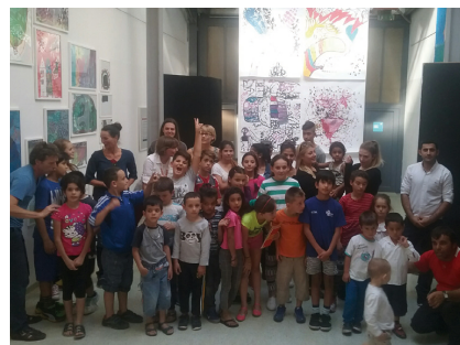
Farben ohne Grenzen Flüchtlingsprojekt mit Kontiki. Vernissage der von den Kindern gestalteten Kunstwerke im September 2015.

Türen öffnen, Einblicke gewähren, Zugänge schaffen, Teilhabe ermöglichen – das ist unser Verständnis von Kultureller Teilhabe und Bildung.