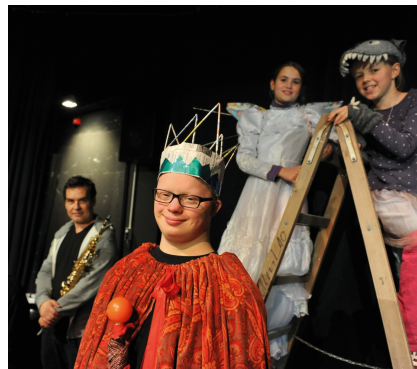
Räubermaria Inklusives Theaterstück des HEYOKA Theaters, Premiere im Dezember 2014. Ausgezeichnet mit dem Amateurtheaterpreis 2015 des Landes Baden-Württemberg in der Kategorie »Theater mit soziokulturellem Hintergrund«

Dieser Raum soll für eine kostenfreie Nutzung durch Künstler und gemeinnützige Institutionen bereit stehen und die Umsetzung von Ideen zulassen, die nicht unbedingt ein »Mainstream-Publikum« anziehen.