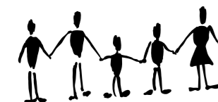
Ulmer Bürger Stiftung