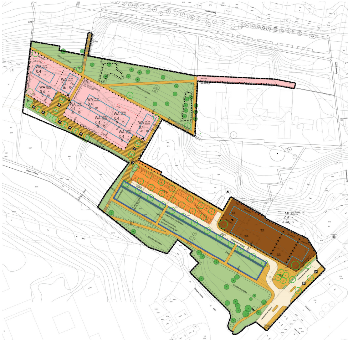
Bebauungsplan 123/7 „Wohnquartier ehemaliges Klinikum Safranberg“

Zur Beurteilung der Auswirkungen der geänderten Planung ist die Flächennutzung nach den Festsetzungen des Bebauungsplans „Wohnquartier ehem. Klinikum Safranberg“ als Ausgangszustand zugrunde zu legen.