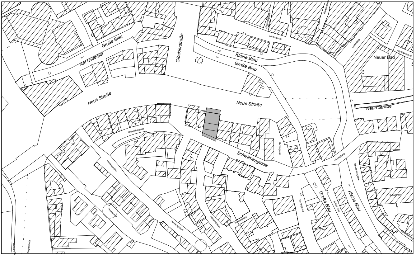
Übersichtsplan Maßstab 1: 2500