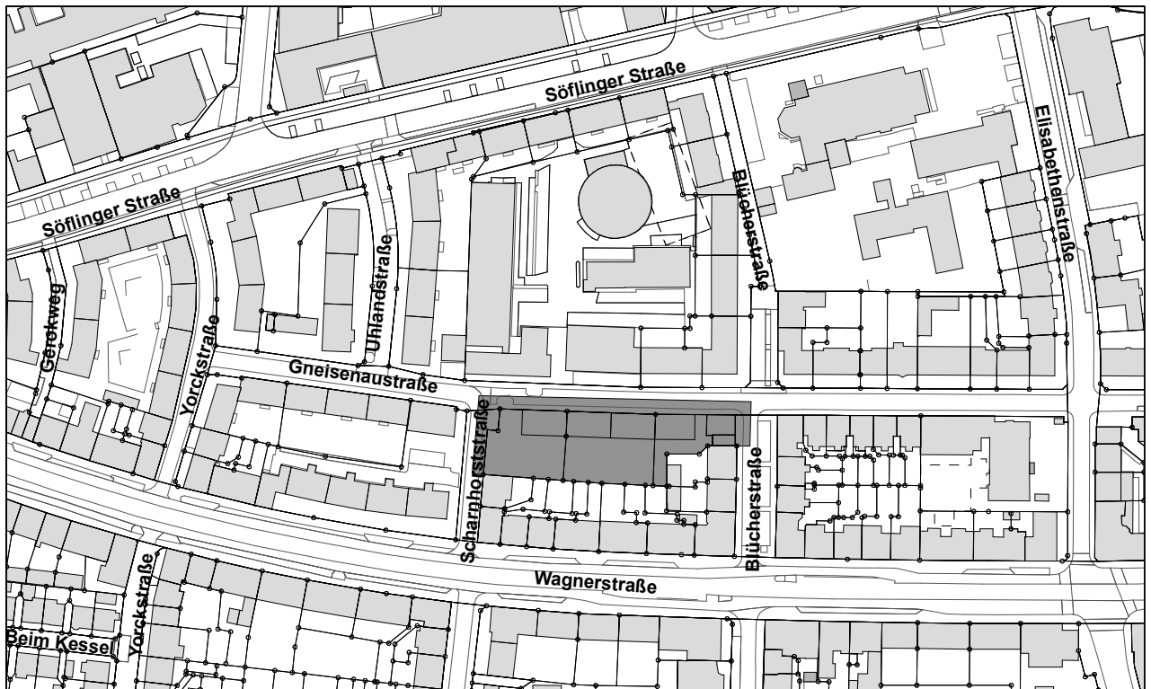
Übersichtsplan Maßstab 1: 2500