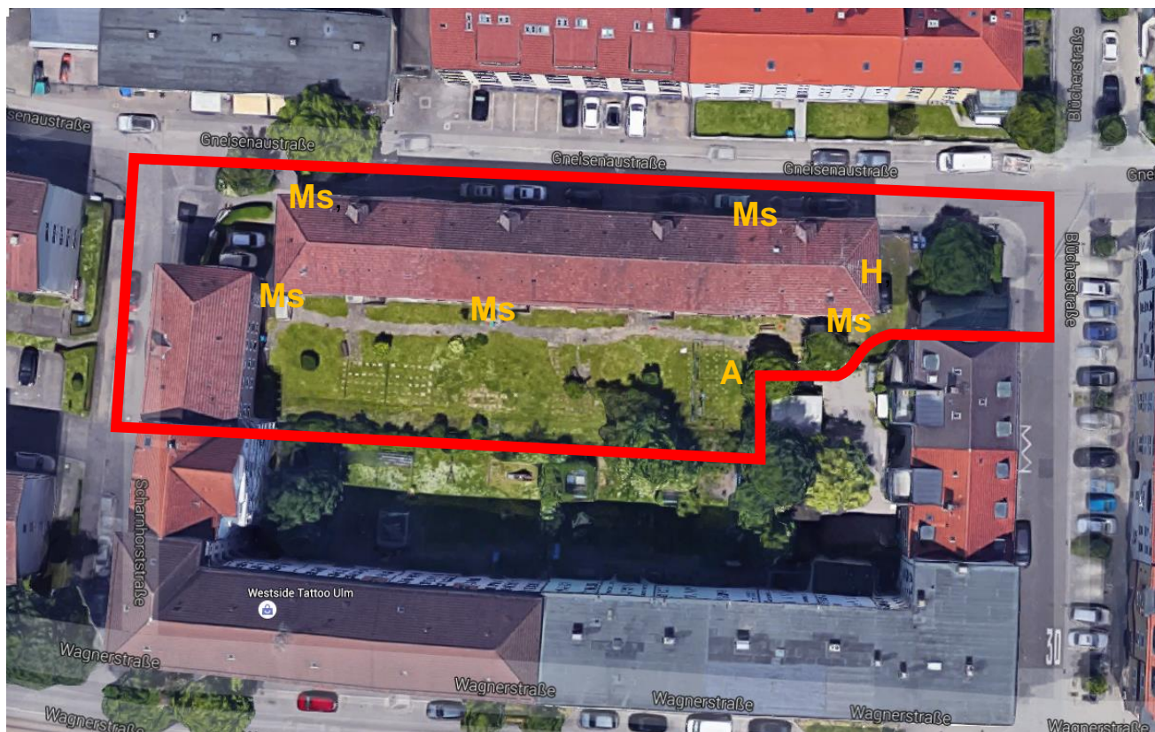
Abb. 2: Nachgewiesene Brutvögel auf der Vorhabensfläche (Abkürzungen vgl. Tab. 2)

Außerdem sind im Umfeld folgende Arten festgestellt worden, die das Gebiet als Nahrungshabitat nutzen können (vgl. Tab. 3).