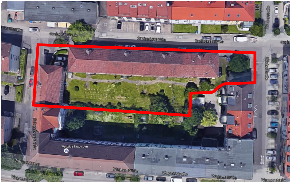
Abb. 1: Lage der Vorhabensfläche

Der Betrachtungsraum der artenschutzrechtlichen Prüfung umfasst das Vorhabensgebiet und den daran angrenzenden Wirkraum. Die Lage der Vorhabensfläche ist aus Abb. 1 ersichtlich.