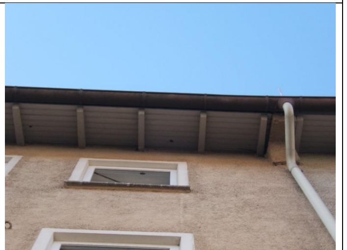
Dachtraufe mit Löchern