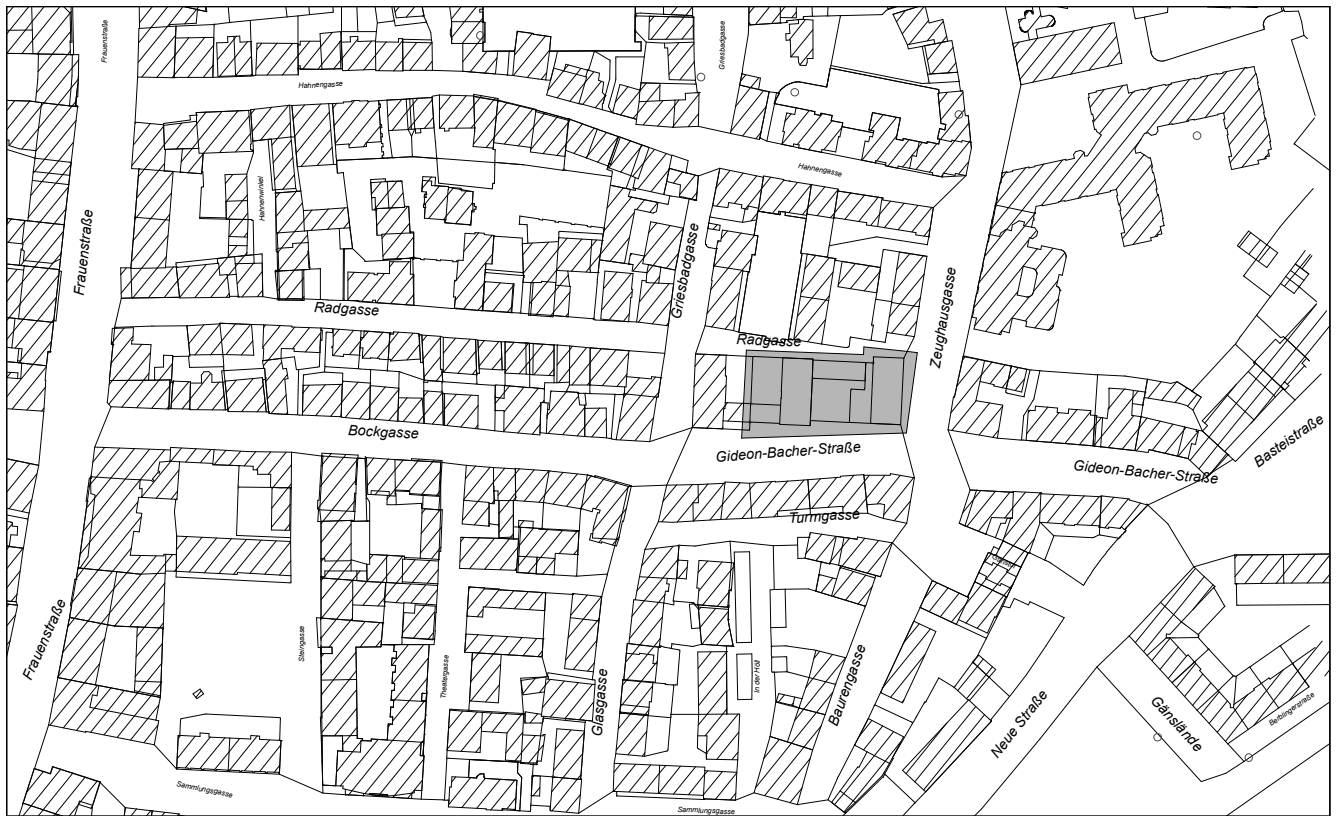
Übersichtsplan Maßstab 1: 2500