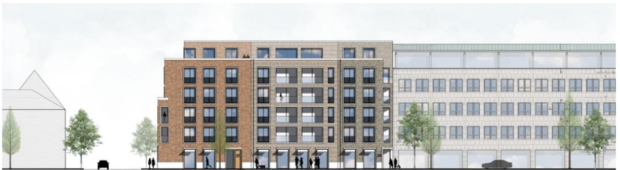
Ansicht Süd, Karlstraße