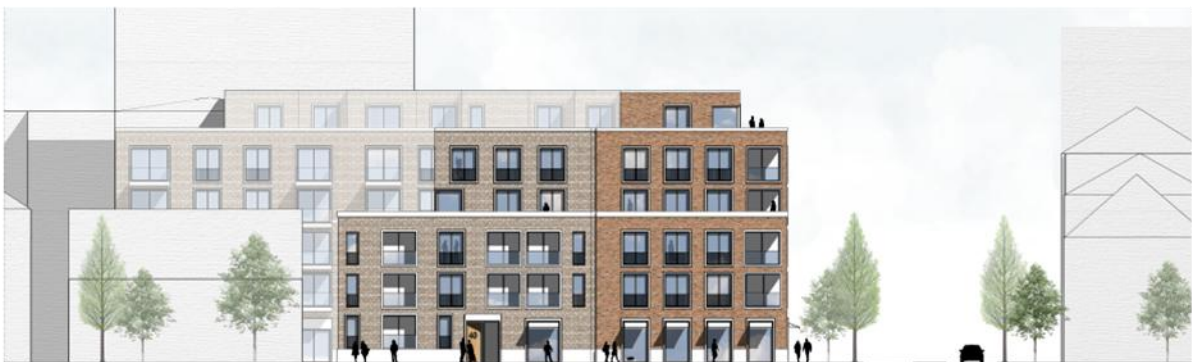
Ansicht West, Ensingerstraße