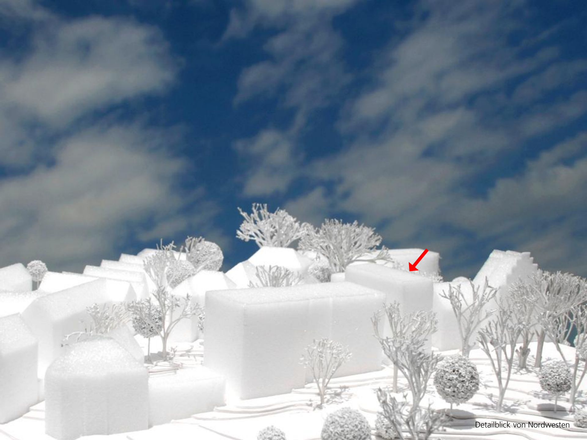
Detailblick von Nordwesten