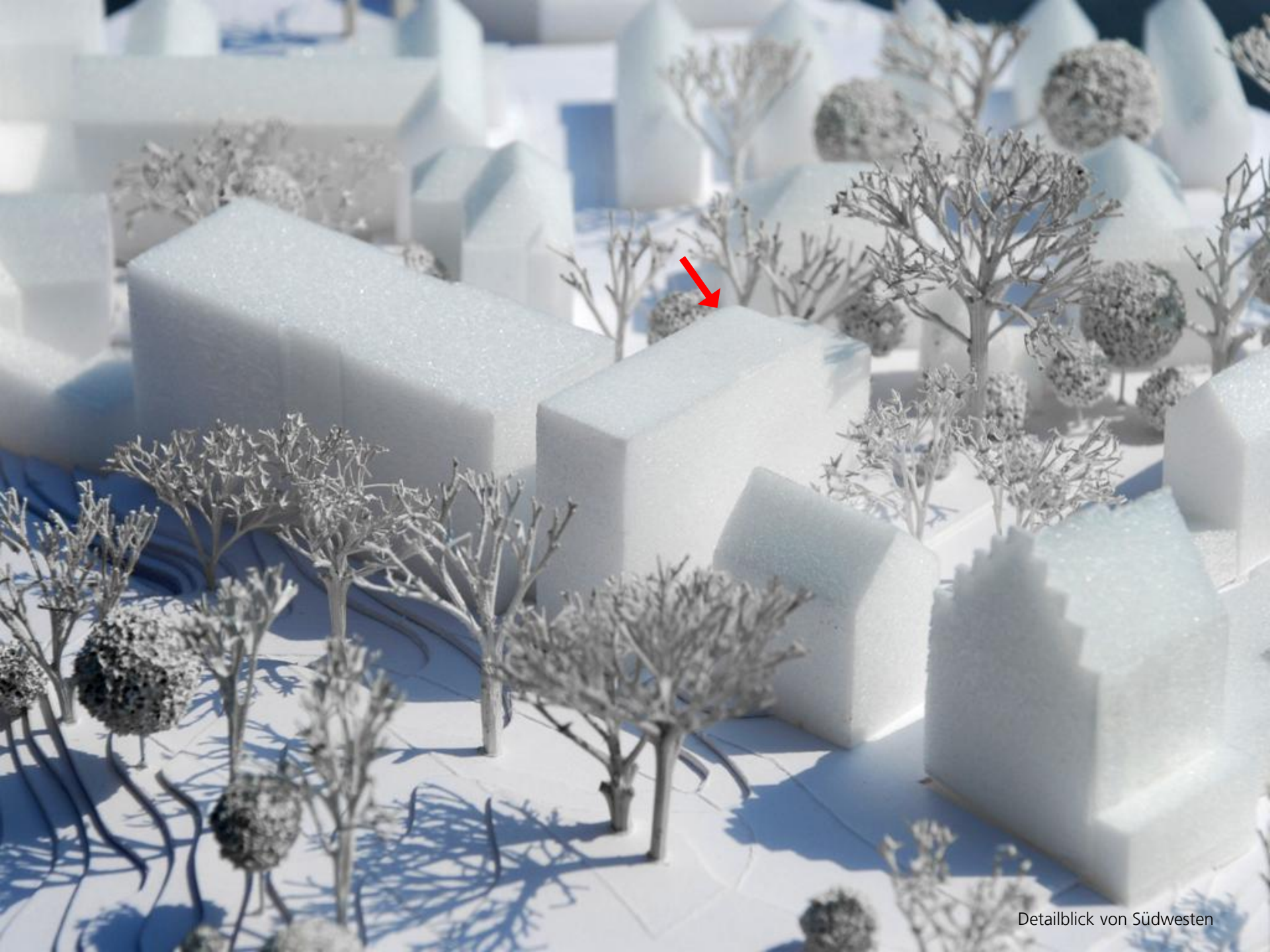
Detailblick von Südwesten