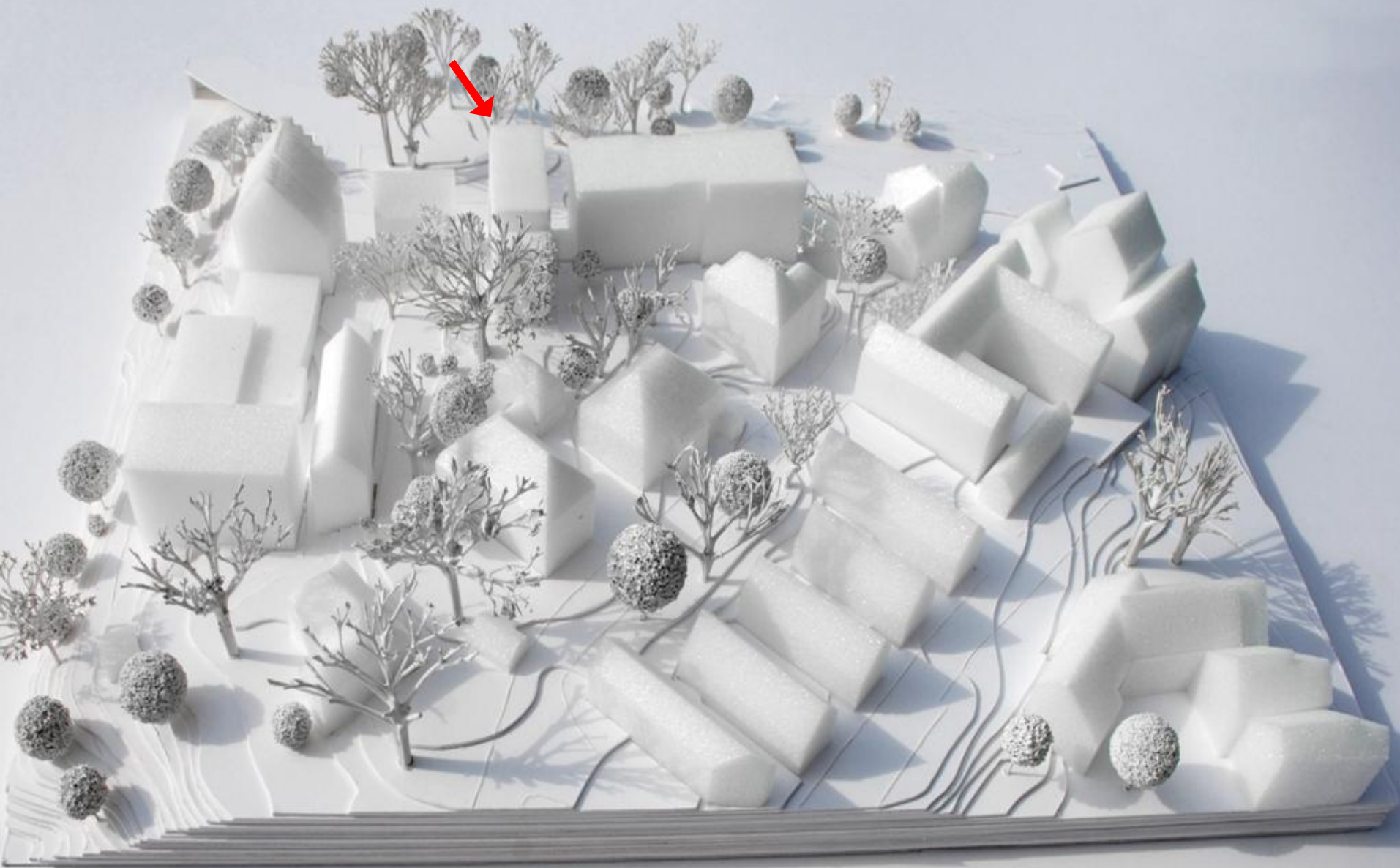
Gesamtblick von Osten