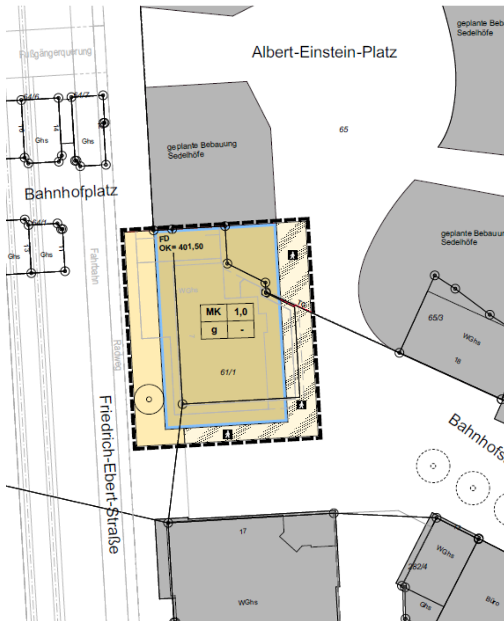
Abb. 1: Lage des Gebäudes

Das Gebäude Bahnhofplatz 7 soll abgerissen werden. Bezüglich der Gebäudeentkernung und des –Abrisses wurde mit den Unteren Naturschutzbehörde vereinbart, dass diese Arbeiten mit einer ökologischen Baubegleitung zu versehen sind und bei Auffinden von artenschutzrechtlich relevanten Tierarten (Vögel, Fledermäuse) die Behörden zu informieren sind.