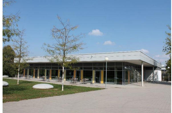
Neue Mensa für das Schulzentrum Oberer Kuhberg

Derzeit befindet sich die neue Straßenbahnlinie „Linie 2“ noch im Bau (Eröffnung der Strecke: Dezember 2018). Sie wird künftig vom Schulzentrum Oberer Kuhberg über den Hauptbahnhof bis zum Science-Park II führen und den Kuhberg direkt mit der Innenstadt verbinden, was die verkehrliche Situation auf dem Kuhberg deutlich entlasten wird.