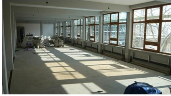
Vorbereitungen zum Einbau des neuen Bodenbelags

Der im Jahr 1954 nach Entwürfen von Max Bill gebaute Gebäudekomplex beherbergte bis zur Schließung im Jahr 1968 die Hochschule für Gestaltung Ulm (HfG) und wurde anschließend bis 2011 von der Universität Ulm zu Lehrzwecken genutzt.