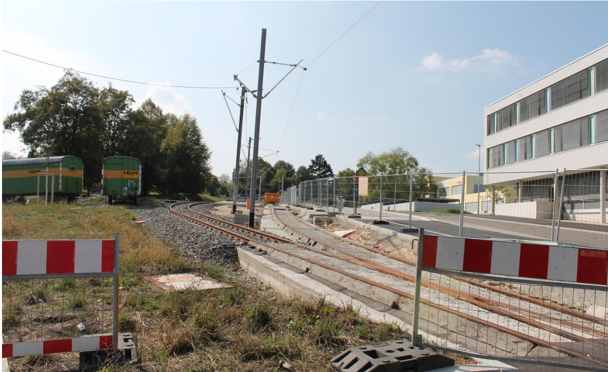
Großbaustelle Linie 2 mit Haltepunkt am Schulzentrum