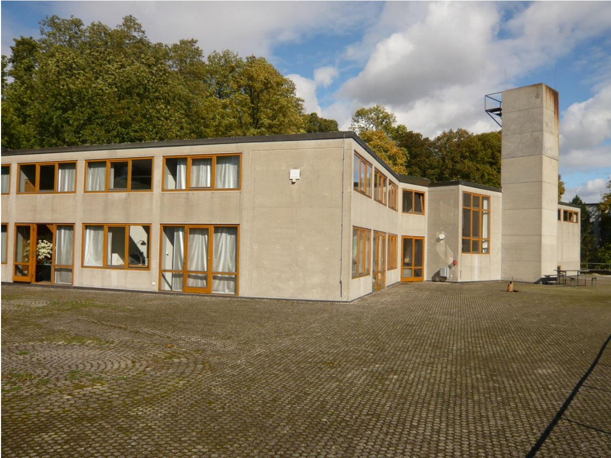
Die triste Terrassenanlage vor der Neugestaltung