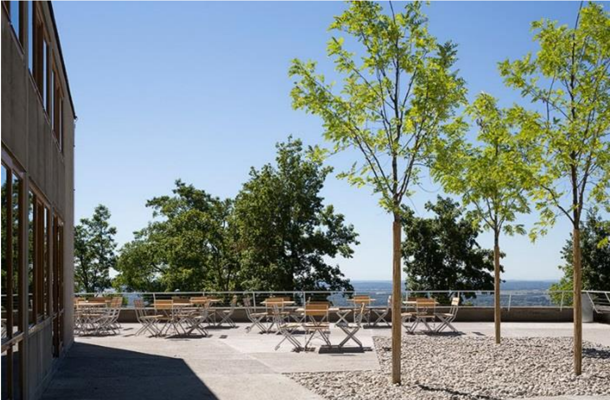
Blick von der Terrassenanlage in Richtung Alpen