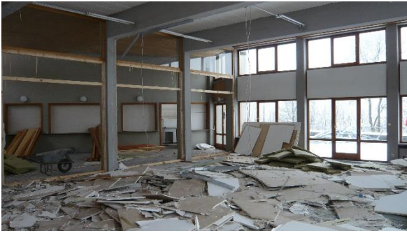
Rückbau der Gipskartonverkleidung