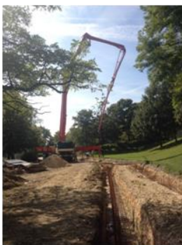
Sanierung der Außenanlagen

Die Terrassensanierung beinhaltet eine Bauwerksabdichtung sowie umfangreiche Dämmmaßnahmen. Die neu gestaltete Terrasse trägt maßgeblich zur Aufwertung der Aufenthaltsqualität bei und ermöglicht somit wieder die eindrucksvollen Blickbeziehungen ins Tal und in die Ferne.