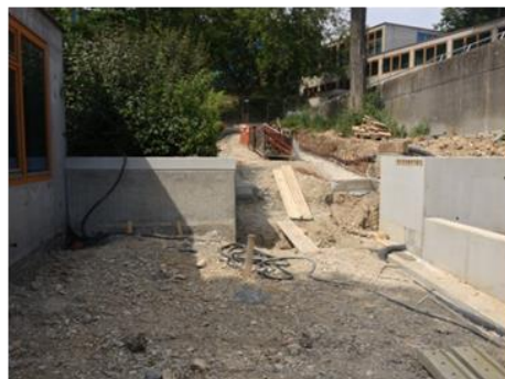
Beginn Umbau der Zugangstreppe