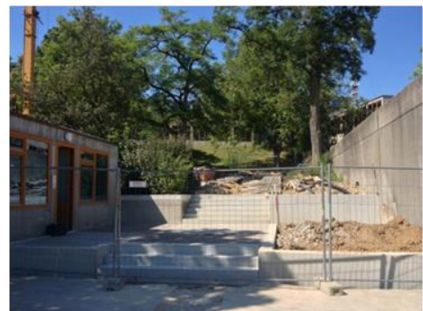
Zugangstreppe während der Bauphase