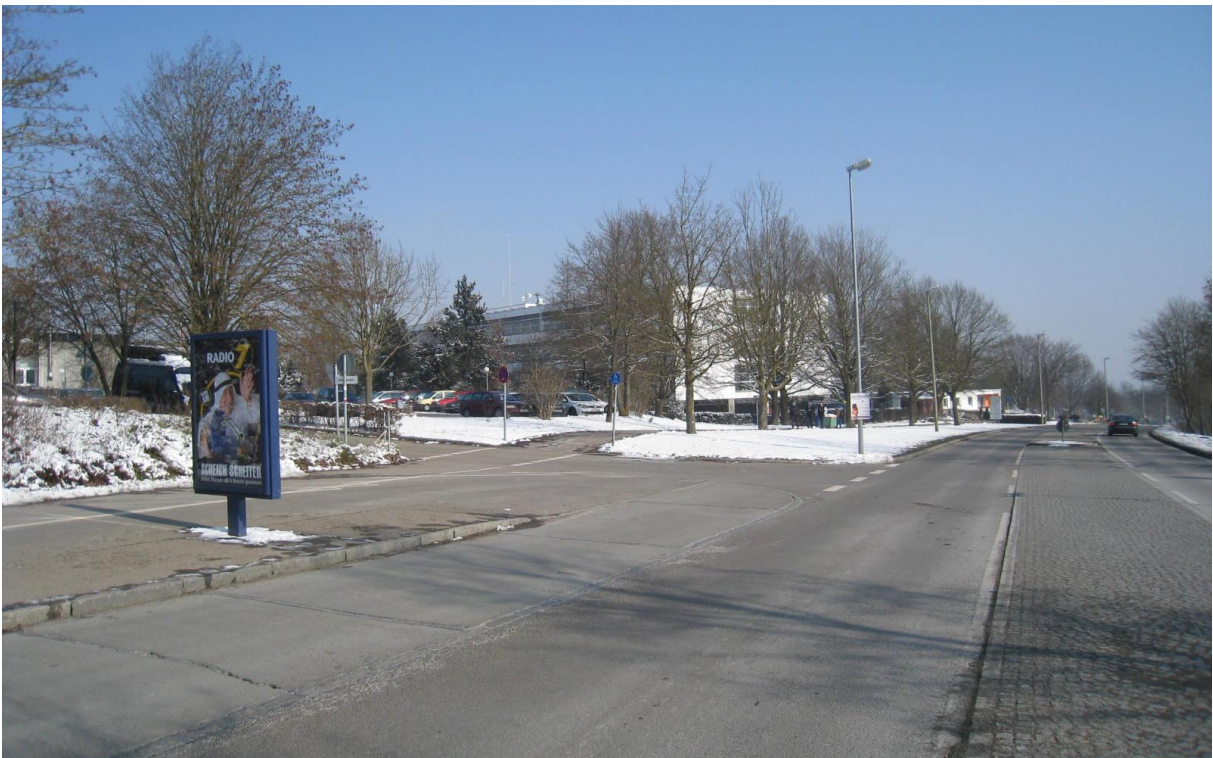
Alte Straßenführung zu den Schulen am Egginger Weg

Derzeit befindet sich die neue Straßenbahnlinie „Linie 2“ noch im Bau (Eröffnung der Strecke: Dezember 2018). Sie wird künftig vom Schulzentrum Oberer Kuhberg über den Hauptbahnhof bis zum Science-Park II führen und den Kuhberg direkt mit der Innenstadt verbinden, was die verkehrliche Situation auf dem Kuhberg deutlich entlasten wird.