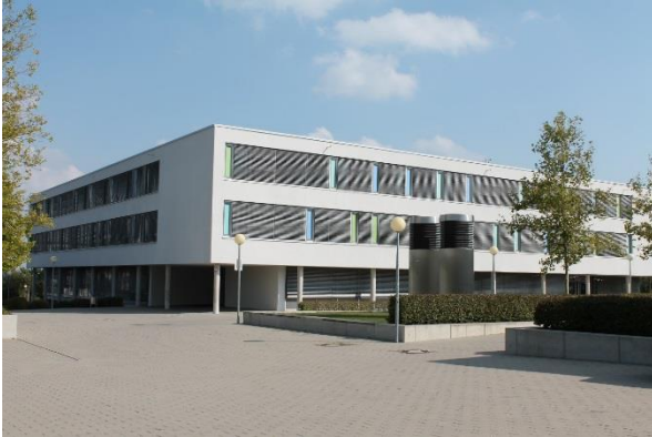
Gemeinsam genutztes Schulgebäude für die Robert-Bosch- und die Ferdinand-von-Steinbeis-Schule