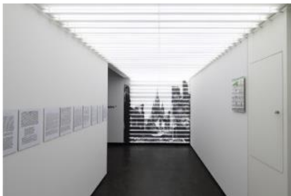
Ausstellungsbereich der HfG