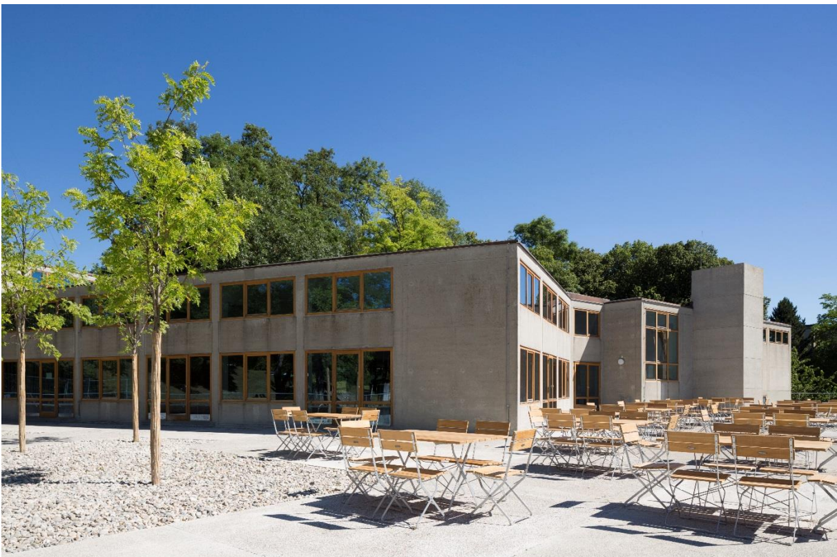
Aktuelle Ansicht der umgebauten und stark frequentierten Terrassenanlage