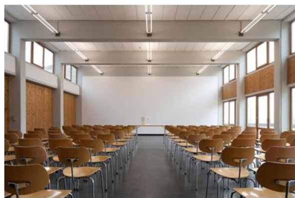
Tagungsraum nach der Sanierung

Der Gebäudekomplex wurde von der Stiftung HfG mit hohem gestalterischem Anspruch in drei Abschnitten umgebaut und in intensiver Absprache mit dem Landesamt für Denkmalpflege modernisiert. Die Baukosten betragen rund 7,4 Mio. Euro.