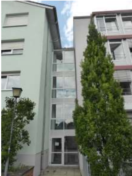
Verbindung zwischen abzurechendem Osttrakt (links) und stehen bleibendem Neubau (rechts).