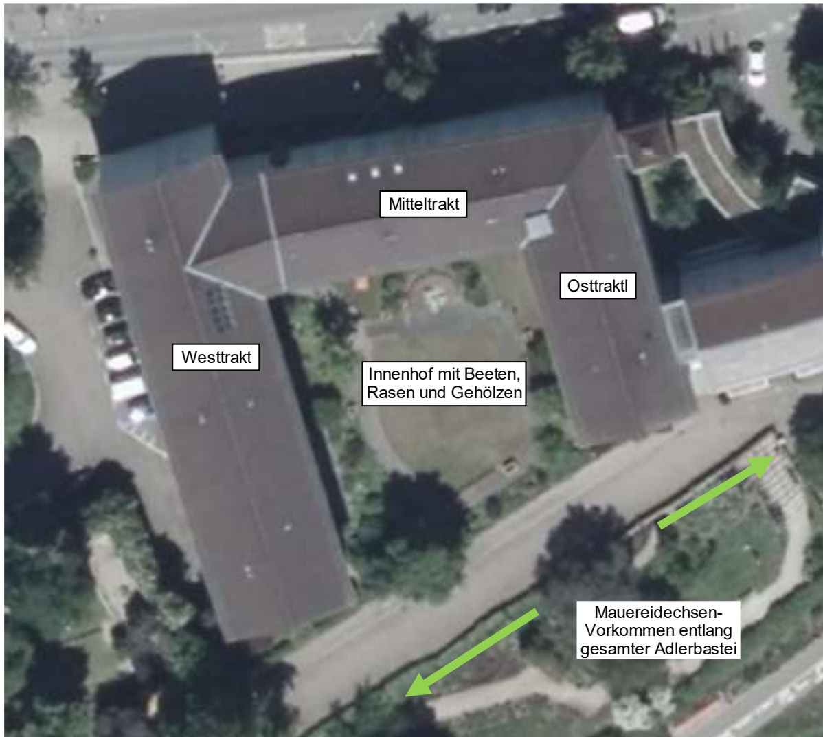
Abb. 2: Überplante Gebäudeteile und Umgebung.

Ergebnisse (siehe auch Fotos im Anhang):