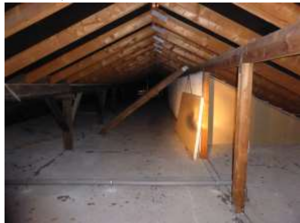
Dachboden, Beispiel 1