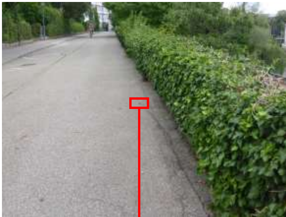
Südlich angrenzender Weg oberhalb der Adlerbastei (rechts)...