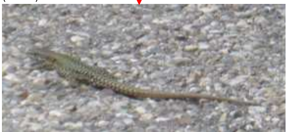
... mit Mauereidechse.