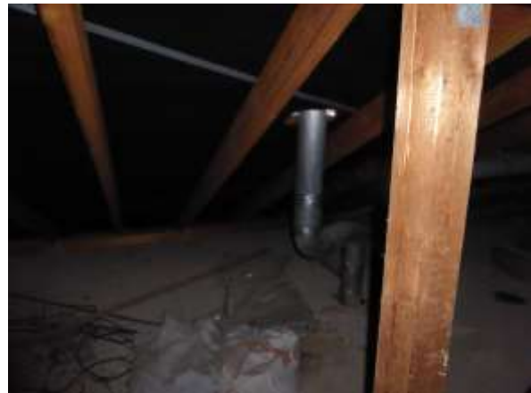
Dachboden, Beispiel 2