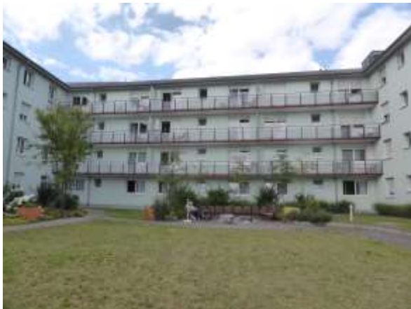
Mitteltrakt, Südseite und Innenhof.