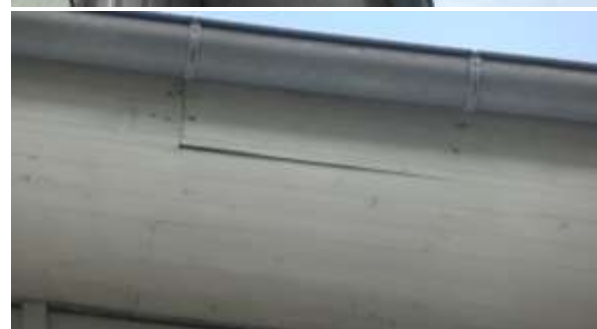
Zwei Lücken in Holzverschalung des Dachüberstands auf Westseite.