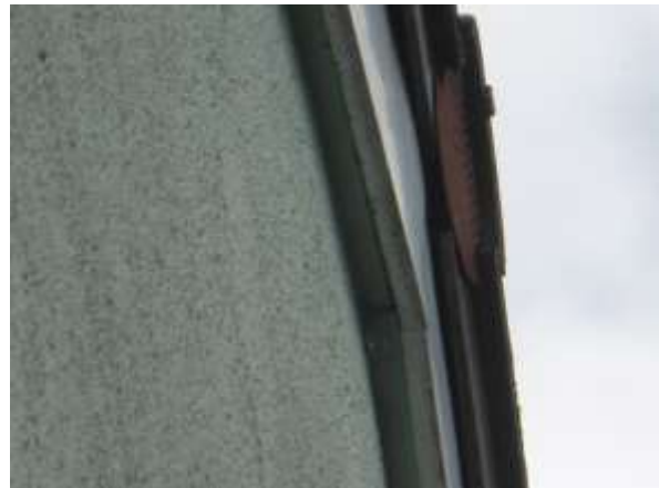
Spalten am Dachtrauf sind entweder dicht oder die Materialien zu glatt zum Festhalten für anfliegende Fledermäuse.