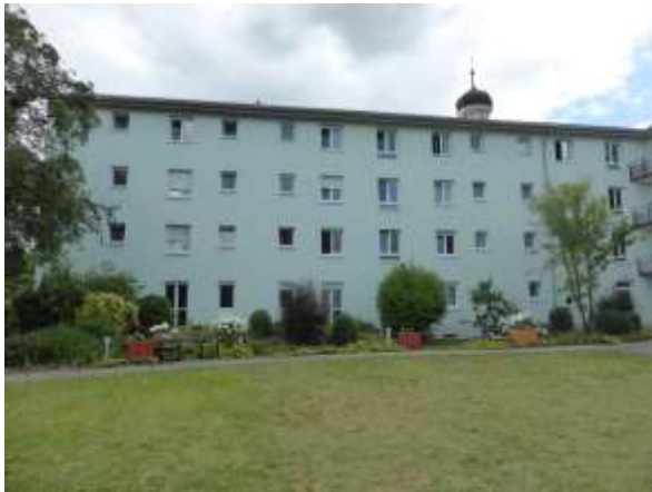
Westtrakt, Ostseite vom Innenhof aus.