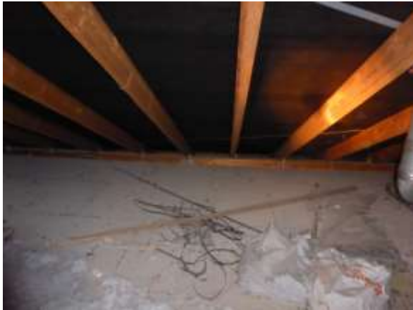
Dachboden, Beispiel 3

Alle Fotos können bei Bedarf auch in größerer Auflösung übermittelt werden.