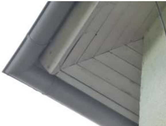
Dachvorsprung an der Nordostecke; in Holzverschalung schmale Lücken, mangels Anflug- bzw. Festhaltungsmöglichkeit für Fledermäuse aber nicht relevant.