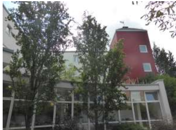
Dto. Nordseite von Osten.