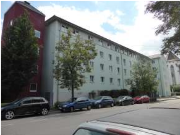
Gesamtansicht der abzubrechenden Gebäudeteile von Nordosten. Fassade glatt, keine Fensterläden oder Rollläden, auch im Dachvorsprung keine Lücken.