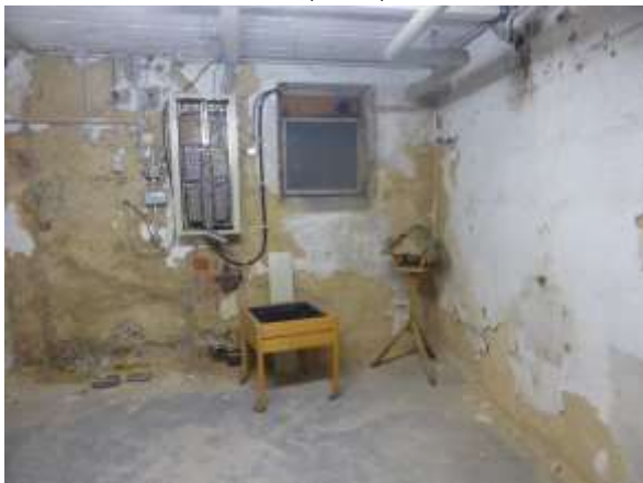
Keller, Beispiel 1