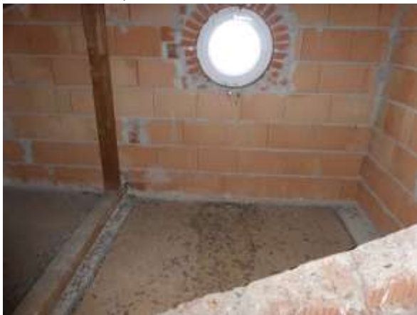
Dachboden, Beispiel 4

Alle Fotos können bei Bedarf auch in größerer Auflösung übermittelt werden.