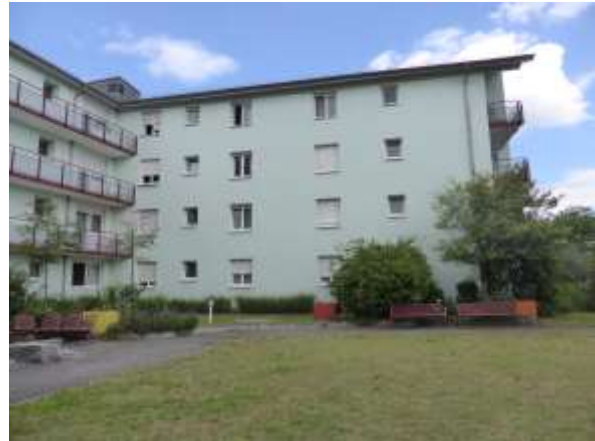
Osttrakt, Westseite, wieder vom Innenhof aus.