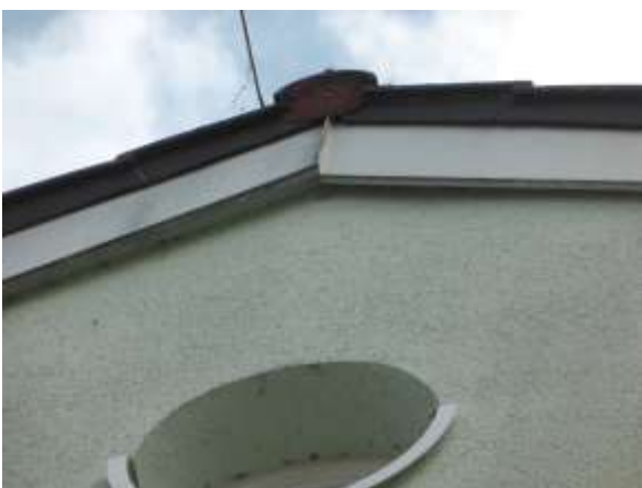
Windbretter im Nordgiebel des westlichen Trakts; die vermeintliche Lücke rechts ist nach wenigen cm ausgefüllt und dicht.