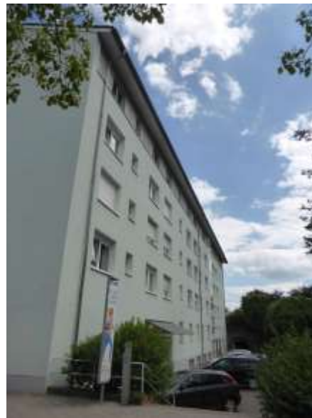
Westseite des abzubrechenden Gebäudeteils.