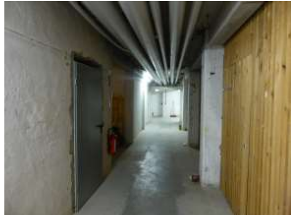
Keller, Beispiel 3