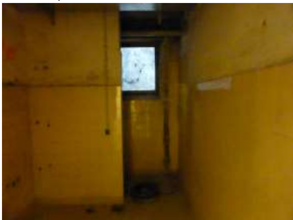
Keller, Beispiel 2