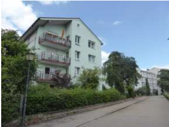
Südgiebel des Westtrakts.