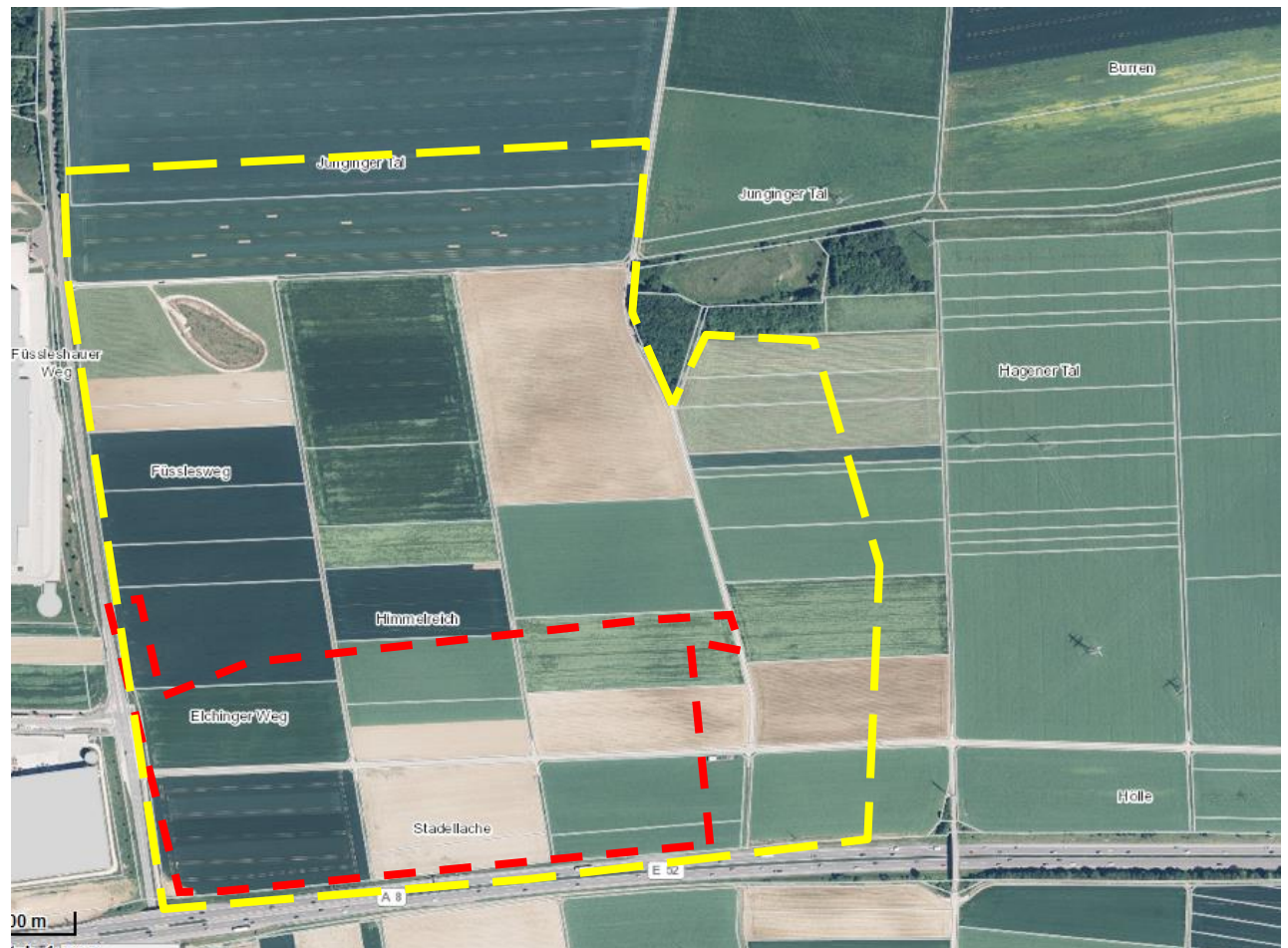
Abb. 1: Vorhabensfläche (rot) und Untersuchungsgebiet (gelb), Luftbild aus udo.lubw.baden-wuerttemberg.de/

Das Untersuchungsgebiet wurde ursprünglich größer gefasst. Ferner umfasst das Untersuchungsgebiet auch die Kulissenwirkung bezüglich der Feldlerche.