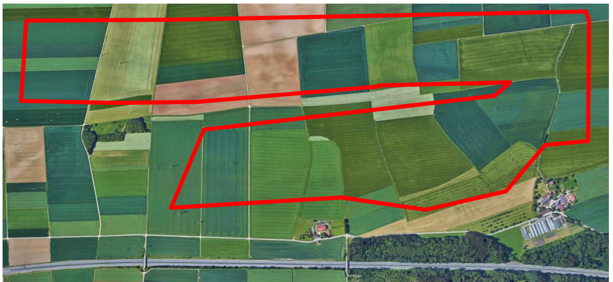
Abb. 3: Suchraum Flächen für Lerchenfenster