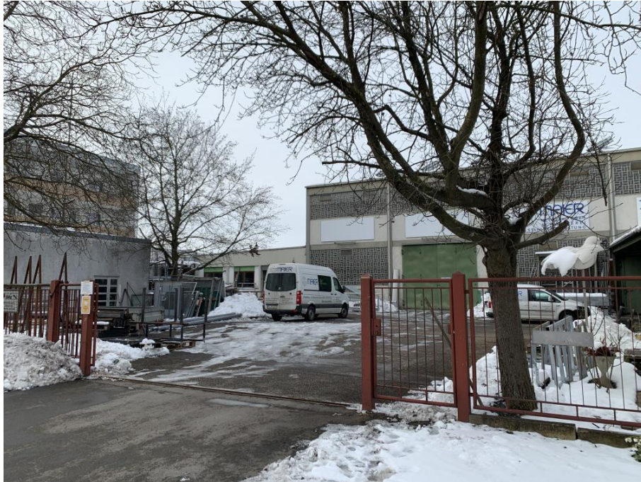
Abbildung 2: Metallbau Maier, Ansicht von Osten