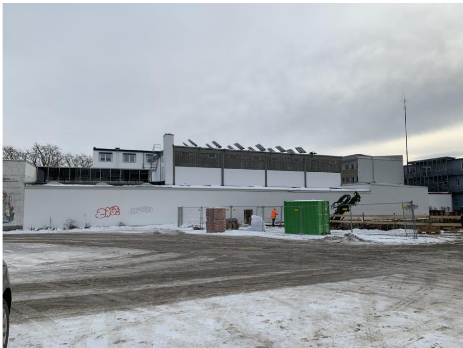
Abbildung 3: Metallbau Maier, Ansicht von Westen