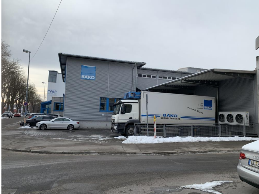
Abbildung 1: BÄKo-Ulm eG, Ansicht von Norden

Der Warenumsschlag und der Verflüssiger befinden sich auf der Ostseite des Betriebs unter einem Vordach. Die Geräusche werden also gegenüber dem Bauvorhaben im Westen durch das Gebäude und das Vordach abgeschirmt.