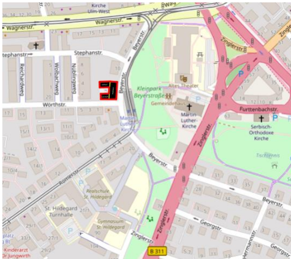
Abbildung 1: Übersichtsplan des Bauobjekts (rot markiert) und relevanter Verkehrswege

Östlich des Plangebiets schließen sich, gemäß untenstehendem Übersichtsplan, die Beyerstraße und die Straßenbahnlinie 2 (Kuhberg – Science Park II in beide Richtungen) an. Im Norden verlaufen die Wagnerstraße sowie die Straßenbahnlinie 1 (Söflingen – Böfingen in beide Richtungen). Des Weiteren sei noch die südöstlich verlaufende B311 (Zinglerstraße) zu erwähnen. Von allen genannten Verkehrswegen ausgehend sind maßgebliche, gegebenenfalls die Wohnnutzung beeinträchtigende, Schallimmissionen zu erwarten. Das Planungsgebiet ist als urbanes Gebiet (MU) definiert.