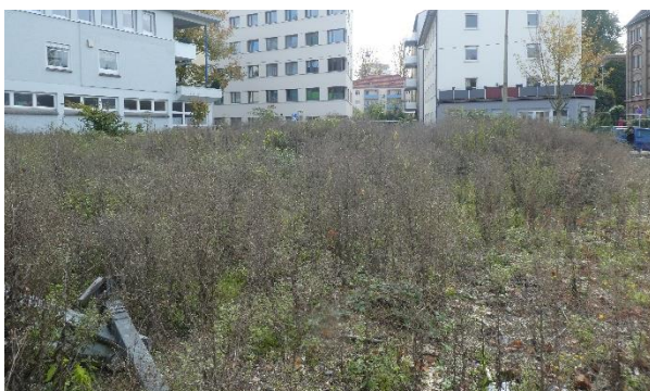
Dto., Blick von Norden.