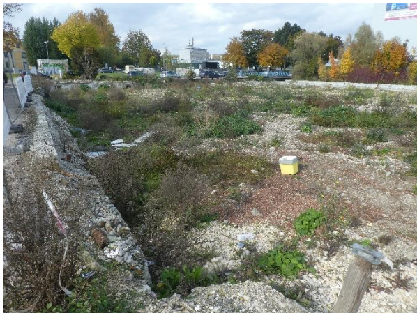
Westteil des Grundstücks, Blick von der Mitte Bleichstraße nach Westen.