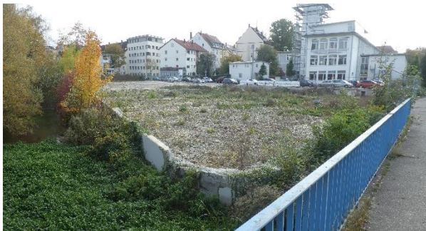
Grundstück, Westseite, Blick von Nordwesten.