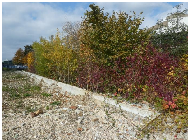
Ufermauer-Reste, ca. auf Kniehöhe abgetragen.