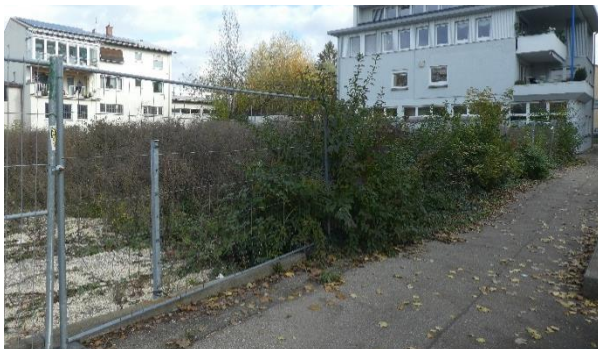
Ostteil mit dichter Stauden-Gehölz-Sukzession, Blick von der Bleichstraße aus..