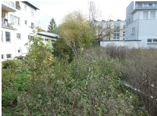
Ufer der Kleinen Blau auf Höhe der Sukzession.