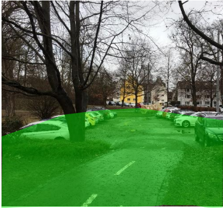
Ostplatz und Böfinger Straße