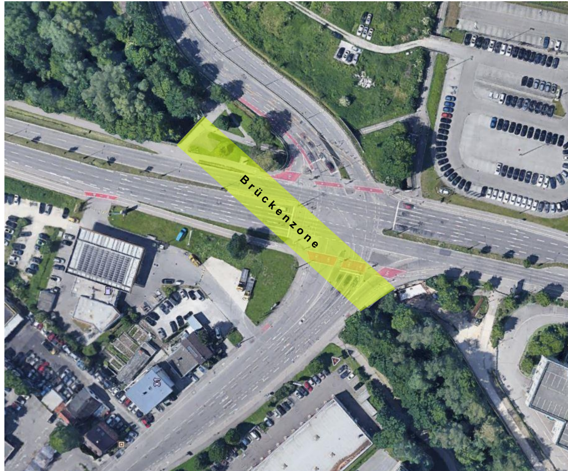
Übersichtsplan ohne Maßstab (Luftbild)