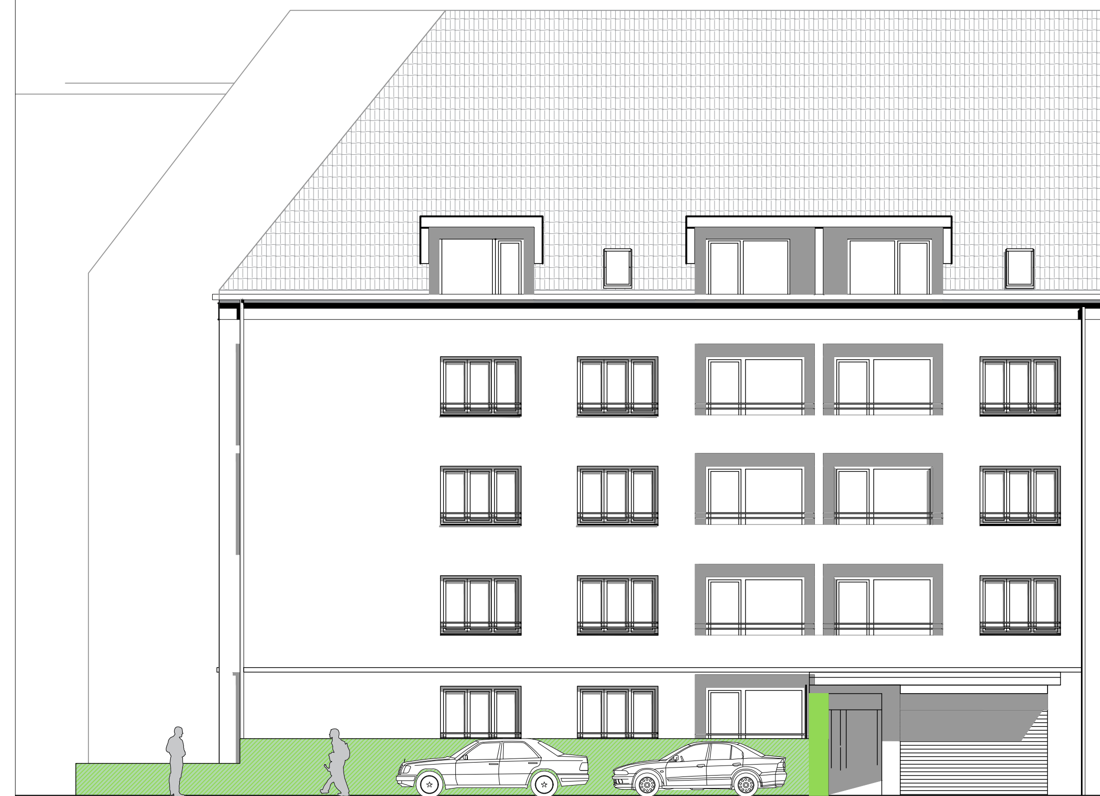
Ansicht Gneisenaustraße M 1:100